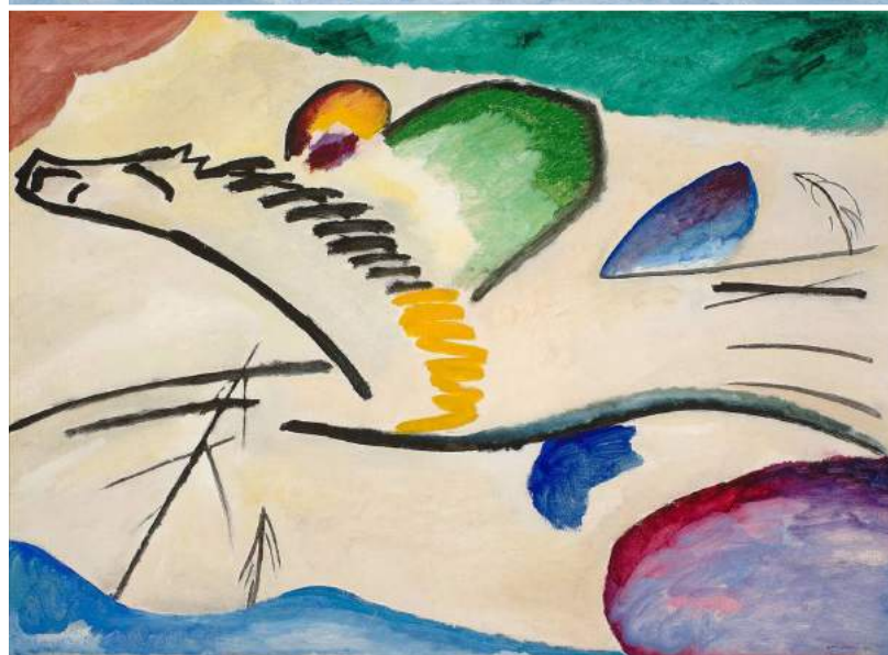
Lyrical, Vassily Kandinsky (1911)