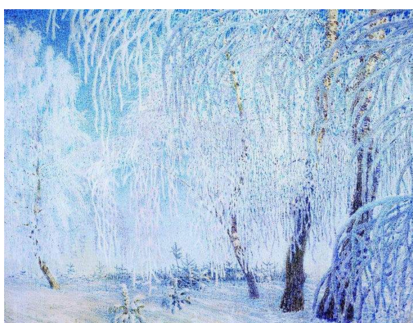
The Frost, Igor Grabar (1905)

Séminaire du laboratoire ÉCHANGES E.A.4236